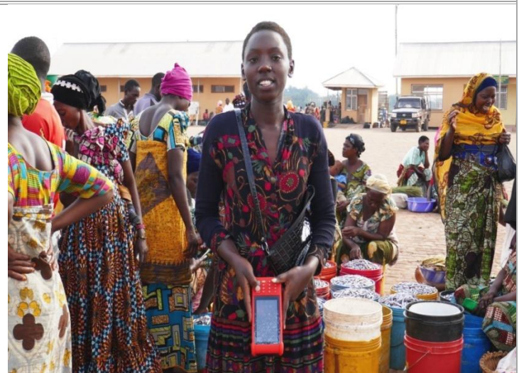
Mkusanya mapato akiwa na mashine mpya za kukusanyia mapato