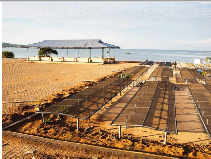
Sehemu mpya ya kukaushia dagaa

Kwa mwaka 2016, mradi wa LIC kwa kuitikia wito kutoka Manispaa ya Kigoma Ujiji ulianzisha uwekezaji ili kuboresha mwalo na soko la samaki la Kibirizi. Uboreshaji wa miundombinu ulijumuisha kuweka sakafu mpya ya vigae (pavements) kwenye eneo la mwalo, mitaro, maduka, mifumo ya maji safi na maji taka, uwekaji wa umeme, sehemu za kukaushia/kuanikia dagaa, vyumba maalum na vifaa vya kuhifadhi samaki na kwa mara ya kwanza uzalishaji wa barafu mkoani humo. Katika kusaidia uwekezaji huu, mfumo mpya wa uongozi uliundwa kupitia Special Purpose Vehicle (SPV).