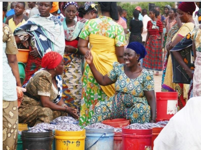
Wanawake wakiuza dagaa kwenye mwalo wa samaki (ufukwe wapanapovuliwa samaki)